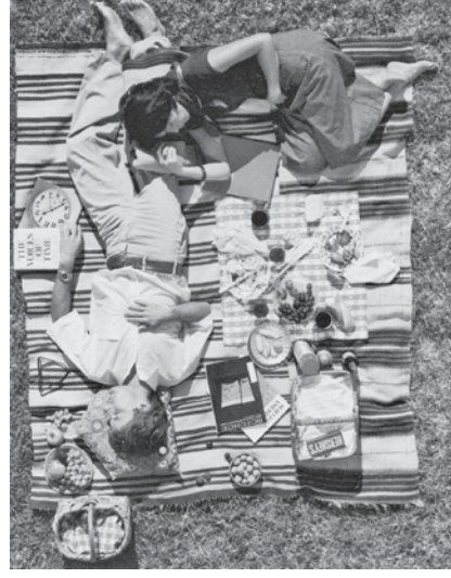
Detalle de Powers of Ten, Charles y Ray Eames (1977)